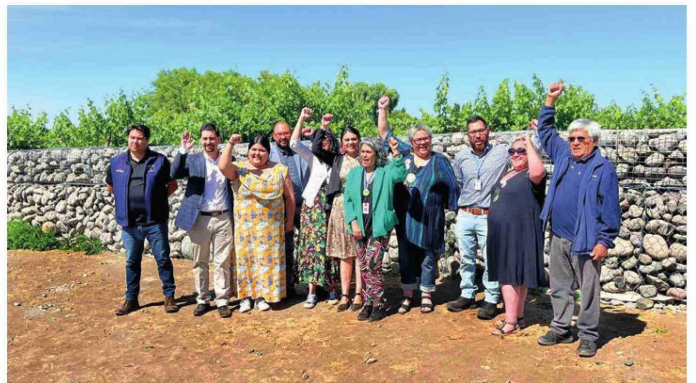
Construcción de pirca de piedra en cementerio Indígena de Tutuquén.

Hubo iniciativas que, por uno u otro motivo, no llegaron a concretarse, mientras que otras sí lo hicieron, aunque su avance fue lento