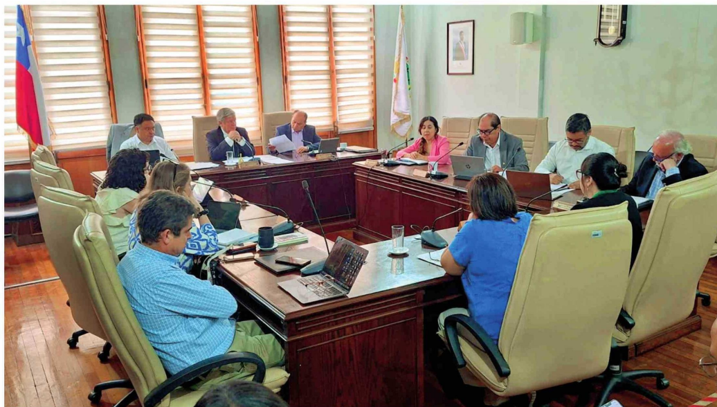
Aun no se realiza la auditoría aprobada por el Concejo Municipal.

Sobre este último, el cementerio indígena más antiguo de Chile y uno de los más antiguos del mundo, situado en el