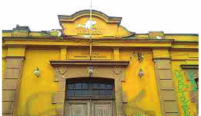
El proyecto de la Escuela Balmaceda tendrá que seguir esperando.