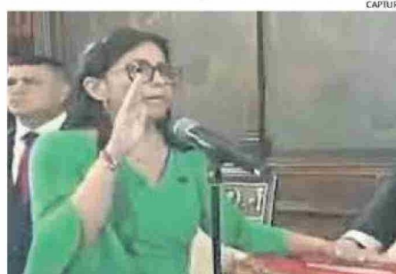
DELCEY RODRÍGUEZ JURÓ COMO PRESIDENTA ENCARGADA.