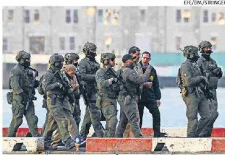
MADURO Y FLORES LLEGARON ESPOSADOS Y VIGILADOS.