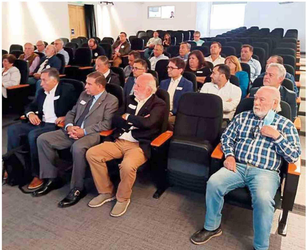
Dirigente espera que las autoridades reciban de buena manera las ideas que un movimiento está afinando para mejorar la calidad de vida de los curicanos en el corto y mediano plazo.

“Aquí hubo un gerente de la CGE que tuvo la intención de hacerlo y si vamos aquí donde está el edificio de los Servicios Públicos hay unas rejillas y ahí iba a empezar eso, pero al final no quedó en nada. Ahora, se han arreglado algunas veredas, pero ahí se debería aprovechar inmediatamente soterrar los cables y después no romper el pavimento de nuevo. Ahí falta visión a futuro”.