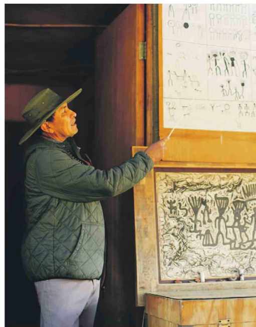
El Observatorio Turístico Cruz del Sur es uno de los principales atractivos de Combarbalá y un referente del turismo astronómico en la Región de Coquimbo.

Tanto la llamada "comuna estrella" como la conocida "tierra de los molinos, la música y la amistad" poseen un sello propio que las hace destacar entre quienes buscan experiencias turísticas enriquecedoras. Naturaleza, patrimonio, tradiciones y gastronomía se conjugan en Combarbalá y Punitaqui, dos destinos imperdibles de la provincia de Limarí.