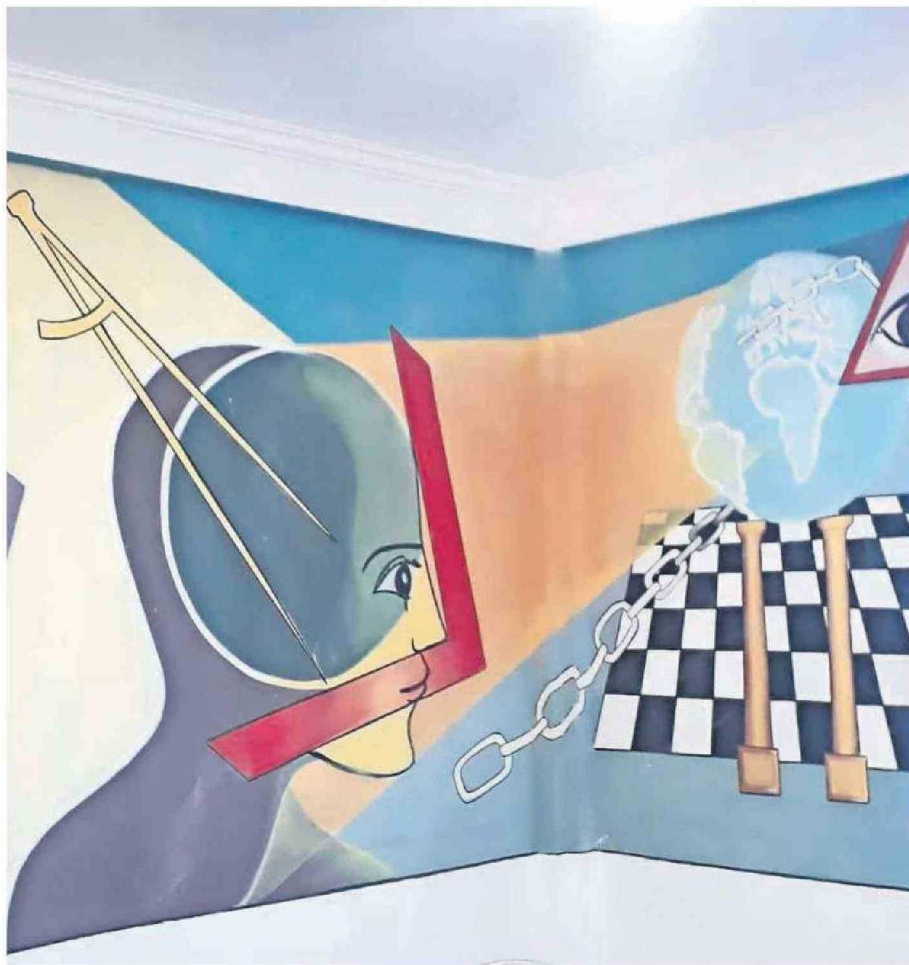
MURALES INTERNOS EN EL EDIFICIO, DONDE SE APLICA LA FILOSOFÍA DE LA APERTURA DE MENTE A QUIENES VISITAN EL LUGAR.