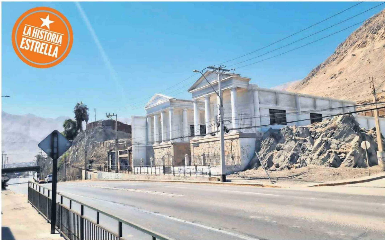
EL PORTENTOSO DISEÑO CON SUS PILARES CORINTIOS QUE HACE ALUSIÓN A LA GRECIA CLÁSICA LLAMA LA ATENCIÓN DEL VIAJANTE QUE ATRAVIESA EL "PUENTE" DE TOCOPILLA.