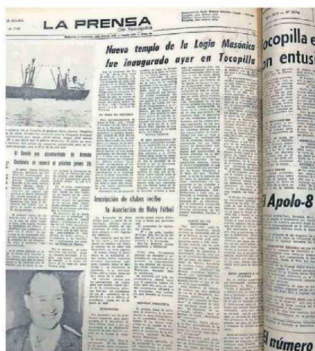
PRENSA DE 1968 INFORMANDO LA INAUGURACIÓN DEL TEMPLO.