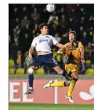
Coquimbo inicia su camino en la Copa Libertadores rescatabiendo un empate en los descuentos ante Nacional de Montevideo. | DEPORTES 2

Reconocidas figuras y nuevos rostros ganan espacios en la escena del humor local. | C 10