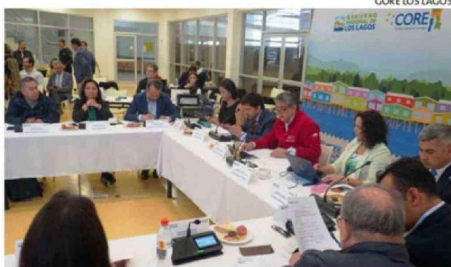
LA APROBACIÓN FUE EN EL ÚLTIMO PLENARIO DEL CORE, EN PALENA.

El gobernador regional, Alejandro Santana (RN), recalzó que el programa "apunta a mejorar la productividad, incorporar economía circular y generar mayor valor agregado, apoyando directamente a trabajadores, pymes y empresas del sector. Aquí estamos