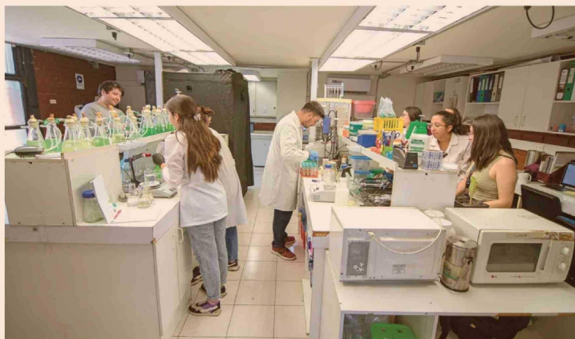
El modelo Usach articula investigación aplicada, propiedad intelectual y transferencia, consolidando la salida de tecnologías al mercado.