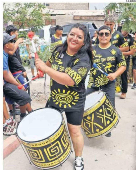
LAS ACTIVIDADES CULTURAS INCLUYERON MÚSICA.

La jornada también tuvo un componente solidario. En el museo participaron BancoEstado y Fundación Techo, quienes realizaron una recaudación de aportes en apoyo a personas afectadas por emergencias en el sur del país. “Fue una celebra-