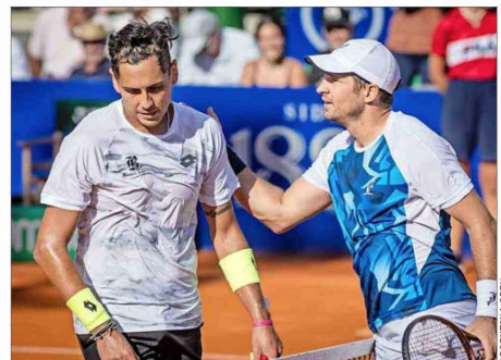
Tabilo perdió en arcilla con Dusan Lajovic en Buenos Aires 2024, pero se vengó en Indian Wells el año pasado.