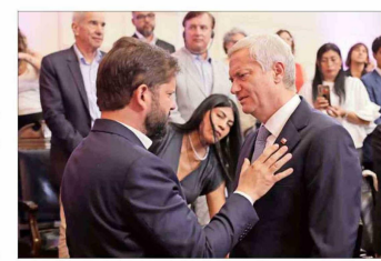
Los mandatarios en ejercicio y electo se encontraron ayer en el Congreso del Futuro.

eternamente si aprobamos o no aprobamos el FES (financiamiento de la educación superior), pero veamos qué es lo más importante. ¿No será más importante el tema de la sala cuna? ¿No será más importante la educación de la primera infancia?", continuó.