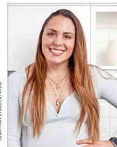
La atleta Natalia Duco se perfila como titular del Deporte en el próximo gabinete, según se comenta, por recomendación de figuras de Evópoli.