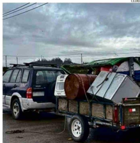
IMPEDIR EL ACCESO A LOS CONTENEDORES ES UNA DE LAS FALTAS.