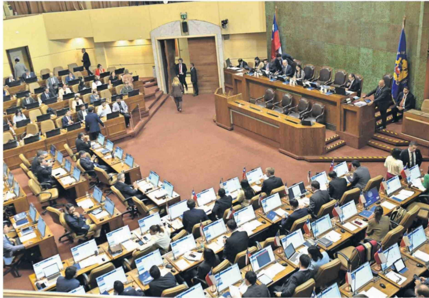
Se espera que el paquete de más de 40 medidas sea conocido por el Congreso en los próximos días.

Voces del oficialismo defienden la presentación de este paquete de más de 40 medidas. Dicen que sólo de esta forma se podrá avanzar rápido en su tramitación.