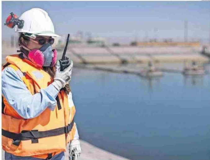
ANTOFAGASTA TIENE EL MAYOR CONSUMO DE AGUA Y SE ESPERA UN RESULTADO SIMILAR LA PRÓXIMA DÉCADA.

En la región ya operan importantes plantas desaladoras,