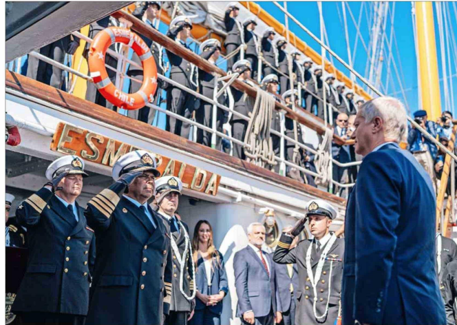
El Presidente José Antonio Kast visitó el buque escuela "Esmeralda", en la antesala del anuncio de la iniciativa.

El cambio de estrategia es directamente atribuido a la dupla política de La Moneda: los mi-