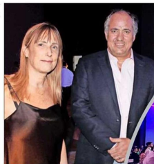
Este martes, en el Metropolitano Santiago, se realizó una nueva versión de la premiación empresarial de EY y "El Mercurio".