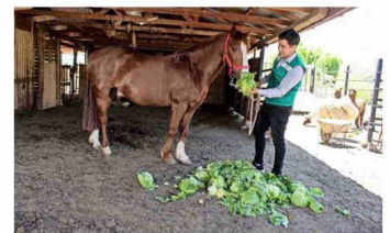
El Departamento de Medio Ambiente de Lo Valledor se encarga de recuperar desperdicios orgánicos limpios para la alimentación de animales.

por medio del Banco de Alimentos, programa que se encarga de recuperar toneladas de comida para 100 hogares de personas vulnerables, y el Departamento de Medio Ambiente de Lo Valledor, que recupera desperdicios orgánicos limpios para la alimentación de animales en zonas de sequía, y genera compost para luego distribuirlos gratuitamente entre pequeños agricultores. Por otra parte, la operación de Infraestructura del mercado logró reducir en 40% el consumo de agua, traduciéndose en un ahorro de 327.205 metros cúbicos de agua.