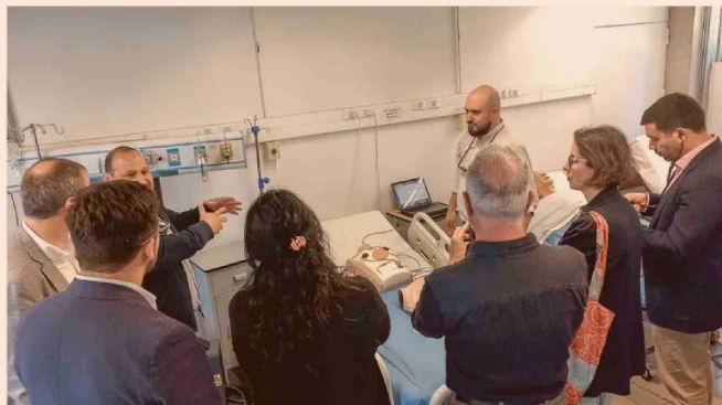
Docentes y estudiantes de UDLA y Duoc UC presentan a autoridades el modelo de simulación clínica que dio origen a la primera patente conjunta entre ambas instituciones.

En ese contexto, la discusión en el ecosistema ha comenzado a desplazarse desde la producción científica hacia la conexión