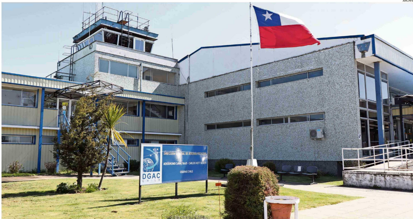
EL AEROPUERTO CAÑAL BAJO DE OSORNO CONCENTRA GRAN PARTE DE LA INVERSIÓN DEL PLAN DE LICITACIONES DE OBRAS PÚBLICAS QUE SE ESPERA MATERIALIZAR DURANTE ESTE AÑO.