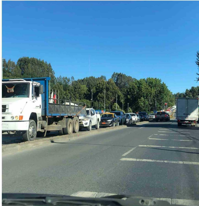
EL TRAMO MOCOPULLI-CASTRO, DE LA RUTA 5 EN CHILOÉ, MUESTRA UNA PERMANENTE CONGESTIÓN.

alcalde de Chiloé, parlamentarios, consejeros regionales y la sociedad organizada, han le-