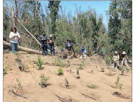
El área a restaurar fue previamente identificada como sitio prioritario para estos fines.

protección del Humedal Urbano de Mantagua, forma parte del