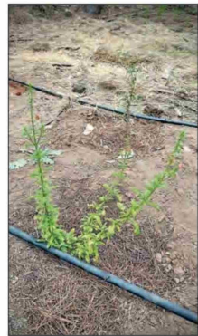
La Alonsoa meridionalis , conocida también como flor del soldado, es una de las especies resguardadas por el proyecto.

"Mejorar las condiciones que hoy observamos en la zona aledaña a los humedales es la mejor inversión en restauración que se puede hacer como sociedad".