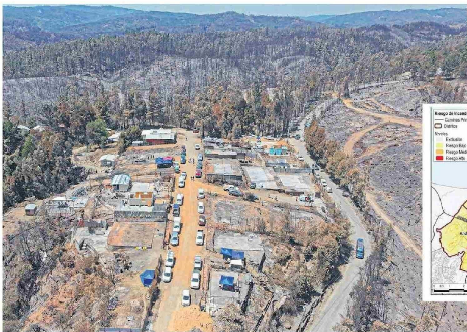
Los incendios forestales de estos últimos días impactaron significativamente a Penco, Tomé, Concepción y Florida.

Tiraje: 10.000 Lectoría: 30.000 Favorabilidad: No Definida