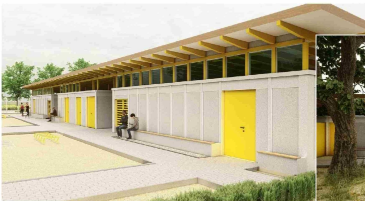
LA PROPUESTA CONTEMPLA camarines para árbitros y jugadores, una bodega para insumos e incluso una enfermería