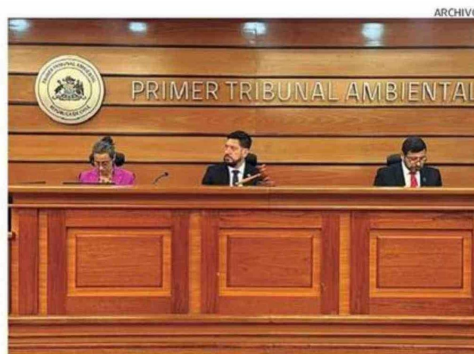
TRIBUNAL DIO CUENTA DE SU GESTIÓN DURANTE EL 2025.

Tiraje: 5.800 Lectoría: 17.400 Favorabilidad: No Definida