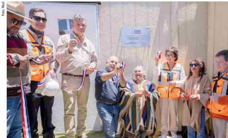
La ministra Williams destacó el proyecto de oro Fenix Gold, la primera iniciativa greenfield en Copiapó en más de una década.

❏ “Para este año está proyectado un precio promedio del cobre mayor al de 2024, estimado en US$4,25 la libra, lo que también podría incentivar el interés por desarrollar proyectos”, adelanta la autoridad.