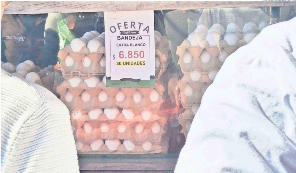
MANUEL MUÑOZ/LA ESTRELLA