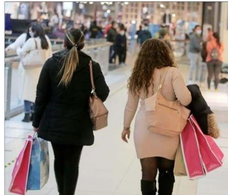
El comercio representa el 20% del total de ocupados y falta recuperar 68 mil puestos para alcanzar el nivel que había previo al inicio de la crisis sanitaria.

das como servicios esenciales, como salud. "Esto se vio poco afectado por las restricciones a la movilidad y, por ende, el empleo se vio poco afectado en