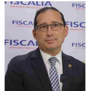
El fiscal regional de O'Higgins, Aquiles Cubillos reveló que ha recibido alrededor de 180 denuncias vinculadas a amenazas en recintos educacionales.

En medio de la creciente tensión que atraviesan las comunidades educativas de la región, el fiscal regional de O'Higgins, Aquiles Cubillos, entregó un balance que pone cifras a la crisis de seguridad, desde que