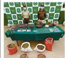
PARTE DE LA DROGA INCAUTADA.

● El seremi de Bienes Nacionales, Eduardo Lazzcano, dio inicio al proceso de elaboración de la Ruta Patrimonial Trasandina de la Región de Valparaíso. En la cita, a la que fueron convocados autoridades y gremios, se pudo avanzar en la articulación de actores y proyectar la continuidad del trabajo colaborativo en torno a la que podría convertirse en la primera ruta patrimonial binacional. "Hay muchos inmuebles fiscales que tienen alto valor patrimonial y en conjunto con otros podemos hacer una ruta", dijo Lazzcano. <3