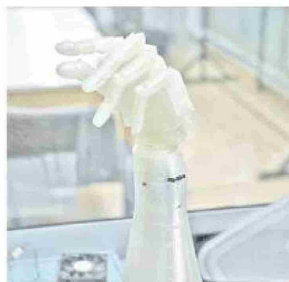
La mano que fue impresa en 3D.

Manos biónicas, robots bailarines y realidad aumentada