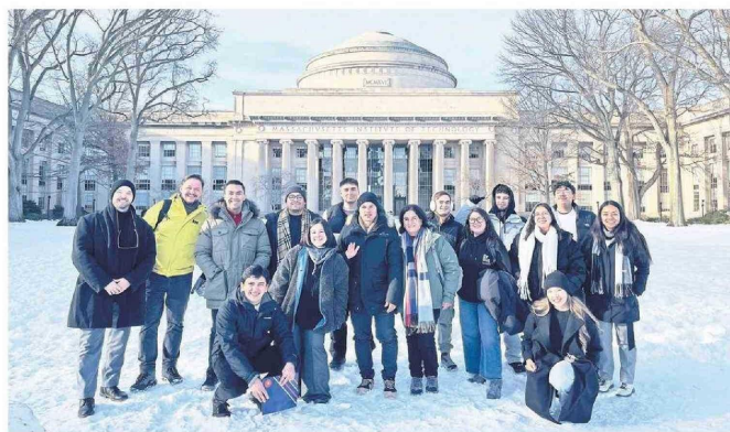
Grupo de visita en Boston durante gira de formación internacional.