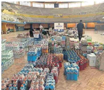
Concepción dispuso un centro de acopio en Gimnasio Municipal.

Desde el municipio también hicieron el llamado a todas aquellas personas, organizaciones e instituciones que estén levantando algún centro de acopio, que se contacten con el espacio destinado por la municipalidad en el Gimnasio Municipal para poder canalizar y gestionar la ayuda.