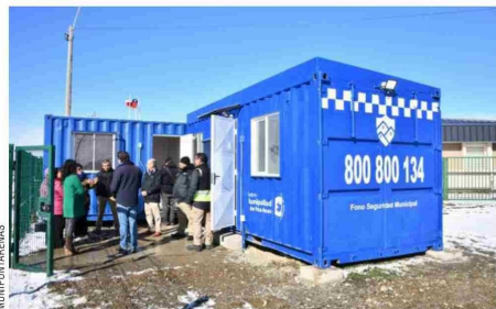
Caseta de Seguridad Municipal en el sector sur.