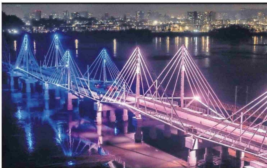
EFE Sur confirmó que para la segunda quincena de julio se pondrá en operación parcial el puente Ferroviario.