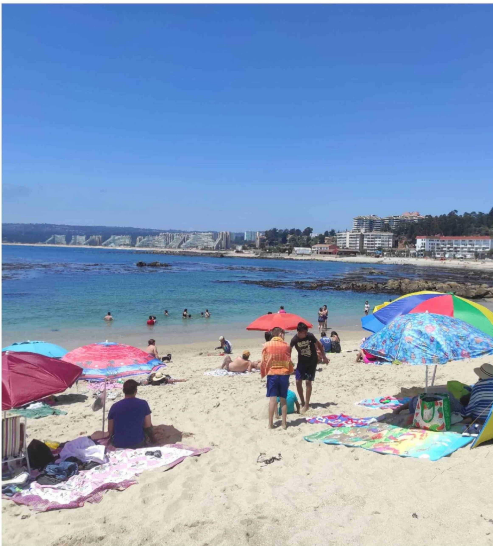
► Semana Santa es el primer fin de semana largo tras el fin de las vacaciones de verano.

Desde la plataforma especializada en viajes en bus, Recorrido.cl sostienen que la demanda en esta fecha aumenta hasta en un 200%. "Los valores, como en todo orden, obedecen a la oferta y demanda. Sí han tenido un crecimiento y es alrededor del 12%, porcentaje normal de un feriado o