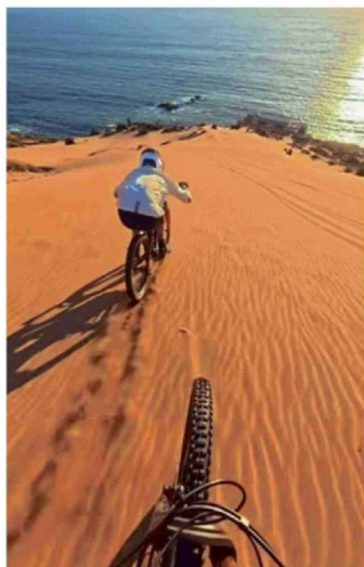
"THIS WAS INSANE!" ((FUE UNA LOCURA)). ASÍ DESCRIBIÓ FISCHBACH LA ACTIVIDAD EN SU VIDEO.

No obstante, tanto expertos en geografía e ingeniería forestal, como