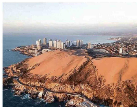
ARAYA: "CADA GRANO QUE SE PIERDE, SE PIERDE PARA SIEMPRE".

organizaciones de la sociedad civil concuerdan que estos hechos no son aislados y, por tanto, las medidas de mitigación no son suficientes.