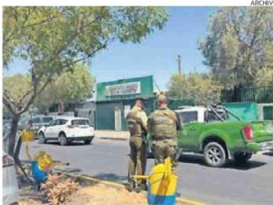
HABLÓ MADRE DE ALUMNO QUE AGREDIÓ CON ARMA BLANCA EN LEZAETA