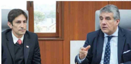
A NIVEL REGIONAL SE REALIZÓ EL ANÁLISIS DEL PROYECTO.

En la instancia, se dio cuenta de que uno de los principales impactos del proyecto será la reducción en el costo del servicio para