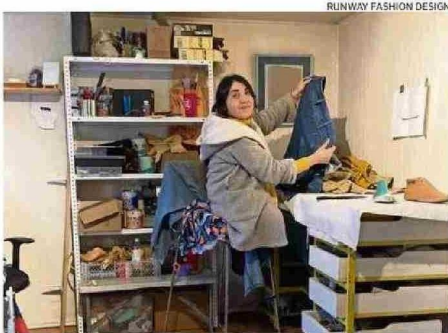
HOY Y MAÑANA SE REALIZARÁ UN SEMINARIO.

“Si bien no existe un seguimiento a los proyectos o marcas una vez que termina el trabajo en la región, RFD las sigue considerando como parte de su comunidad por lo que de alguna u otra manera siempre se le entregará apoyo. Genera esta oportunidad de participar en el programa sin costos per-