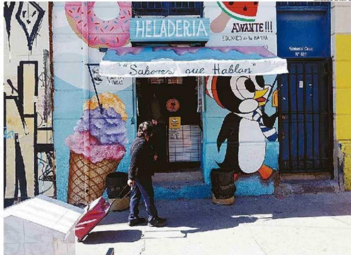
SABORES QUE HABLAN” CONTINÚA LA TRADICIÓN DE IGLÚ EN NUEVO LOCAL DE GENERAL CRUZ ESQUINA COLÓN.

99 departamentos, locales comerciales y estacionamientos contempla el proyecto en calle General Cruz.