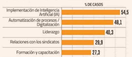
¿Cuál es el nivel actual de incorporación de inteligencia artificial (IA) o automatización de procesos en su área de Gestión de Personas?