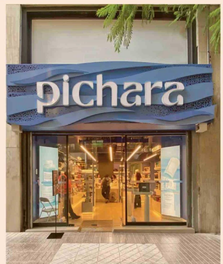
Nueva tienda Huérfanos.

"Estamos constantemente buscando acercar a Chile las principales tendencias y marcas del mundo de la belleza. La llegada exclusiva de Balmain Hair Couture representa un hito para nosotros, porque combina lujo, diseño y calidad