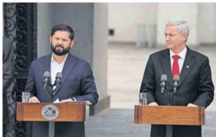
BORIC Y KAST DIERON UNA DECLARACIÓN CONJUNTA.

En esa línea, aprovechó de agradecer la "prudencia" y el espíritu de colaboración de Kast para evitar polémicas en mo-