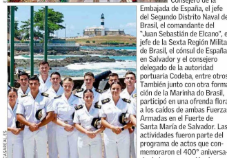
Salvador de Bahía de manos de los holandeses por parte de una flota combinada hispano-portuguesa.