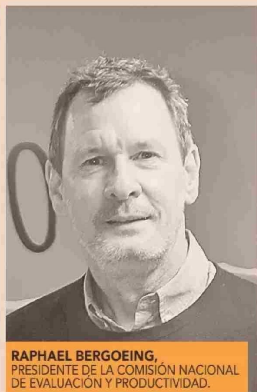
RAPHAEL BERGOEING, PRESIDENTE DE LA COMISIÓN NACIONAL DE EVALUACIÓN Y PRODUCTIVIDAD.