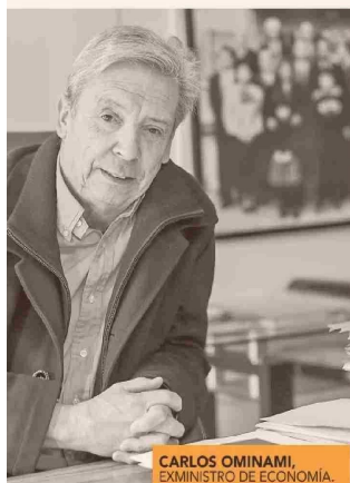
CARLOS OMINAMI, EXMINISTRO DE ECONOMÍA.