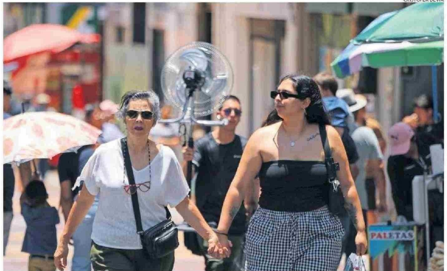
COSTO DE VIDA E INSEGURIDAD ENTRE MOTIVOS QUE ESTARÍAN EMPUJANDO QUE LAS PERSONAS DEJEN LA REGIÓN DE ANTOFAGASTA.