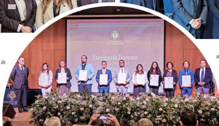
Los docentes premiados de la sede Concepción recibiendo sus diplomas reconociendo su excelencia académica 2024.