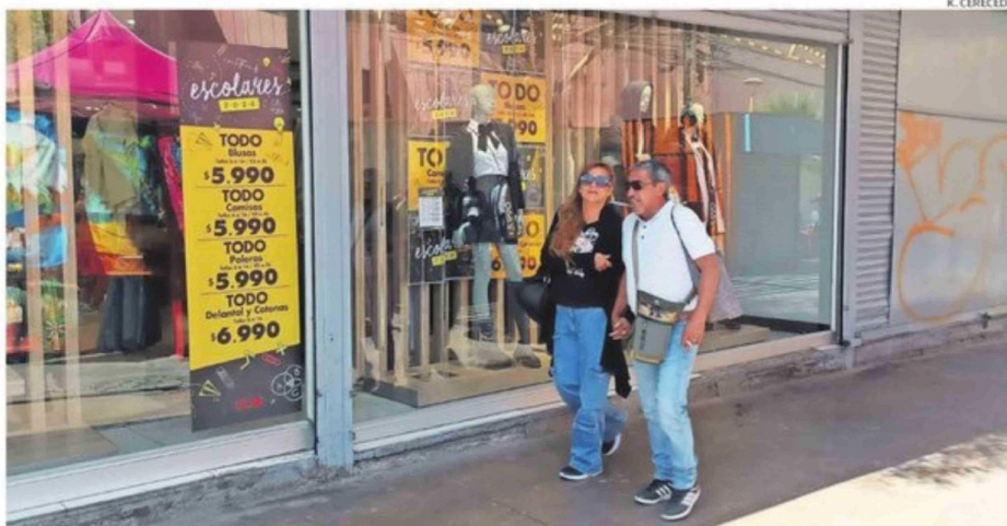
LAS VITRINAS DE VARIAS TIENDAS DEL COMERCIO YA LUCEN LOS UNIFORMES ESCOLARES PARA ESTE AÑO LECTIVO.