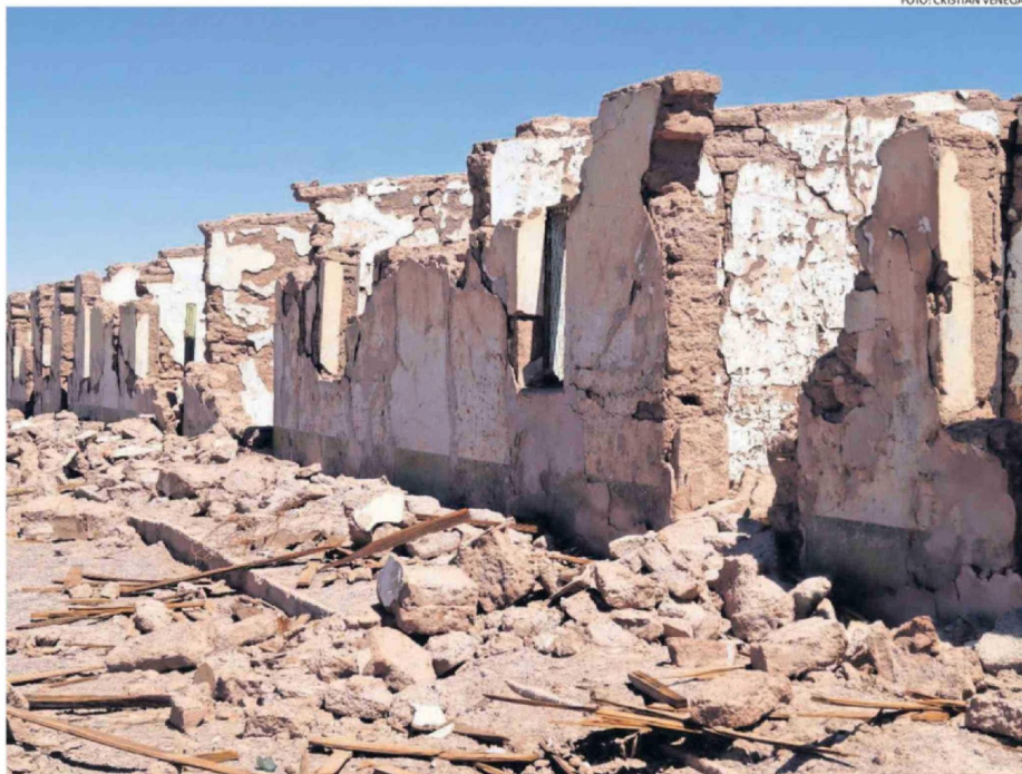
LAS RUIÑOSAS PAREDES DE CONCRETO DE LAS VIEJAS VIVIENDAS ES TODO LO QUE QUEDA DE LA EXOFICINA JOSÉ FRANCISCO VERGARA.

La oficina José Francisco Vergara (cuyo nombre proviene de un político y militar que combatió en la Guerra del Pacífico) se fundó en 1918, con el inicio de su primera producción de salitre.