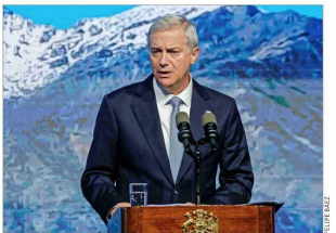
El Presidente expuso en el seminario Latam Focus, organizado por BTG Pactual.

"De aprobarse, puede marcar un antes y un después en el desarrollo de nuestra patria", dijo ayer en la Moneda el Presidente José Antonio Kast, al firmar el proyecto de ley de Reconstrucción.