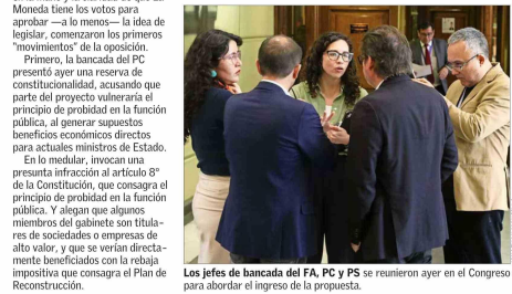
Los jefes de bancada del FA, PC y PS se reunieron ayer en el Congreso para abordar el ingreso de la propuesta.

Dijo, por ejemplo, que el proyecto implicaba un "debilitamiento del Fondo Común Municipal" que iría en contra del "fortalecimiento y el desarrollo equitativo de las regiones, las provincias y las comunas".