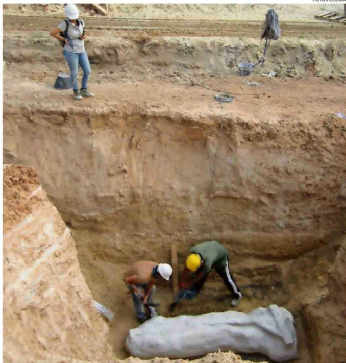
LA INVESTIGACIÓN USÓ ANTECEDENTES DE MONITOREOS A OBRAS EN COQUIMBO.